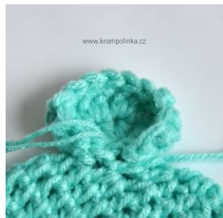
Obr. 6 – přímo do čepice navážeme přízi pomocí ŘO