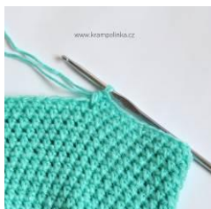
Obr. 5 – přízi pro poslední řadu zdvojíme

19. řada: háčujeme PDS do mezer, celkem 43 PDS